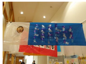
みんなのこいのぼりが 廊下に並んだよ♪