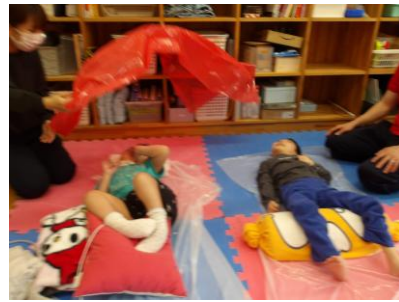
ふわふわ～きれいだね