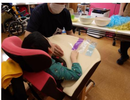
ビニールテープを並べて こいのぼりの模様になろう