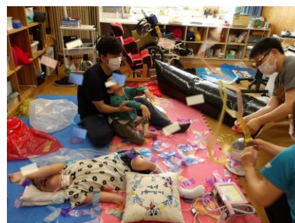
小さく切ったビニールテープを 飛ばしてみよう