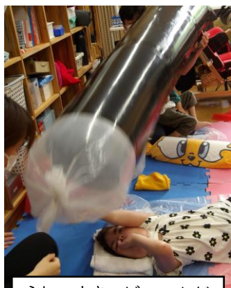
うわー大きいビニールが 飛んできた～