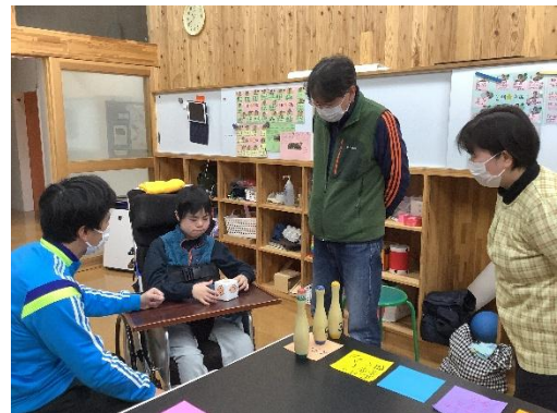
すごろく！何が出るかな