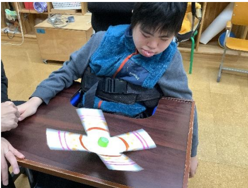
紙パックでコマ作り

お正月の遊びでは、コマや凧、すごろくを手作りして遊びました。すごろくは、保護者も参加し、おいに盛り上がりました。