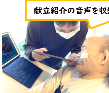
献立紹介の音声を収録…