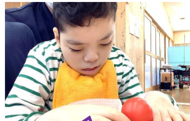
握ったボールを袋詰め