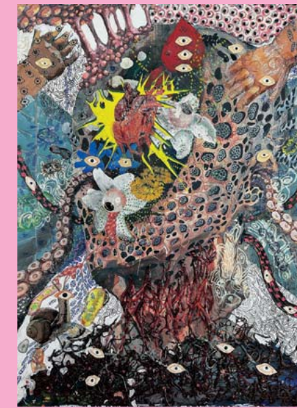
木村さん (2024年3月卒業) 「存在」 アクリル、ケント紙 第67回西日本読書感想画コンクール (西日本審査) 最優秀賞・文部科学大臣賞