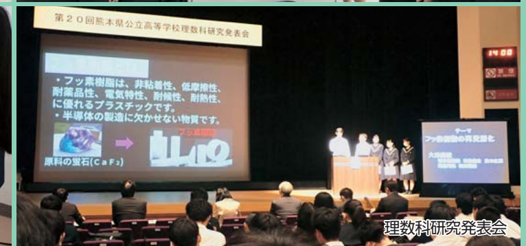
理数科研究発表会