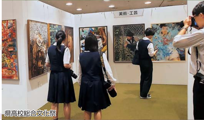
県高校総合文化祭