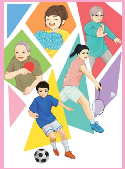
八田さん (2年) 「広報イラスト」 デジタルペイント NPO 法人クラブきくよう