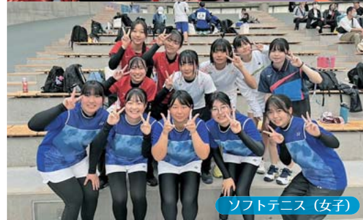
ソフトテニス(女子)