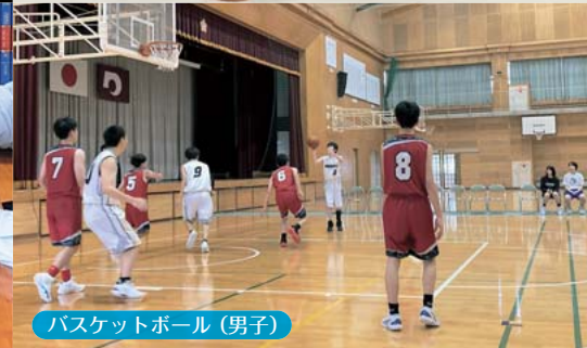
バスケットボール(男子)