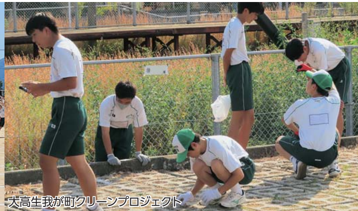
大高生我が町クリーンプロジェクト