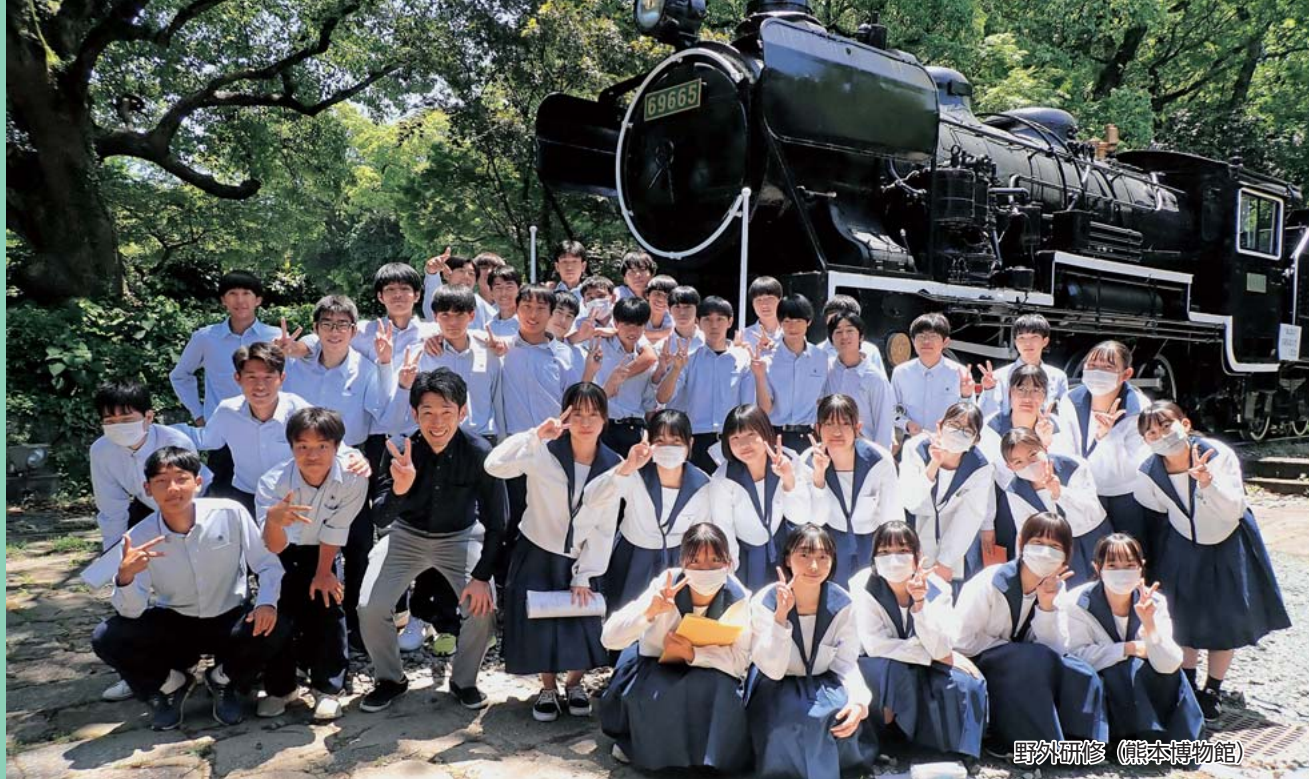
野外研修 (熊本博物館)