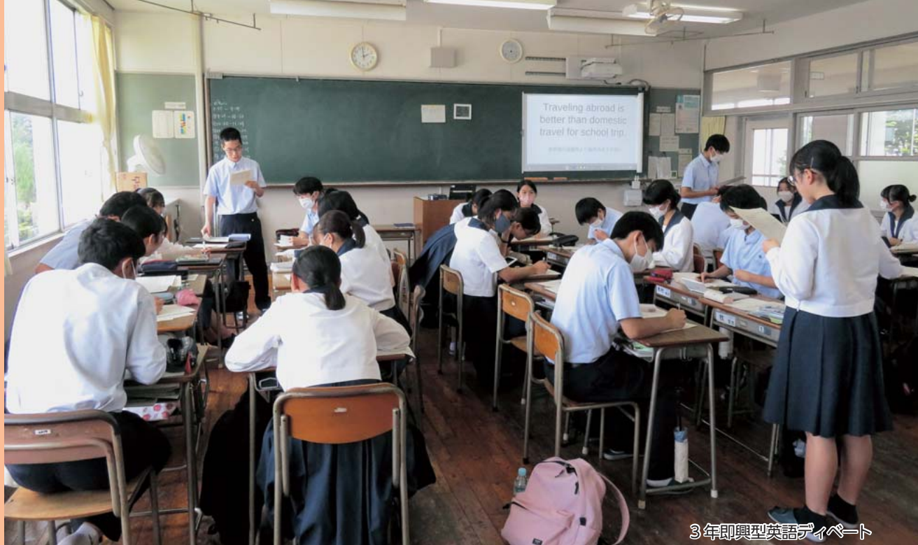
3年即興型英語ディベート