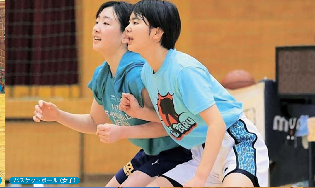
バスケットボール(女子)