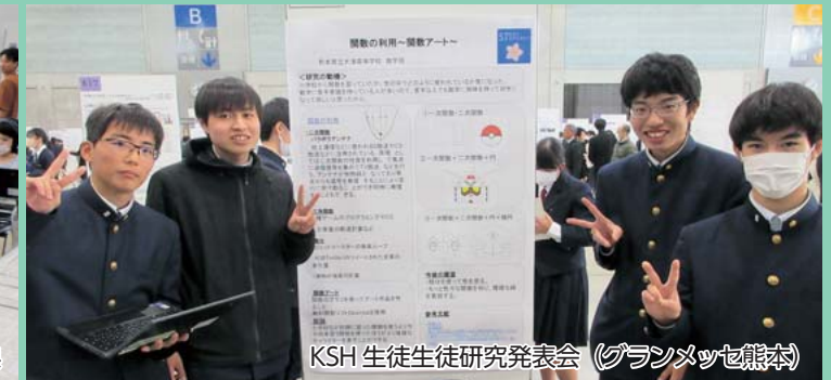
KSH 生徒生徒研究発表会 (グランメッセ熊本)