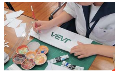
ビジュアルデザイン