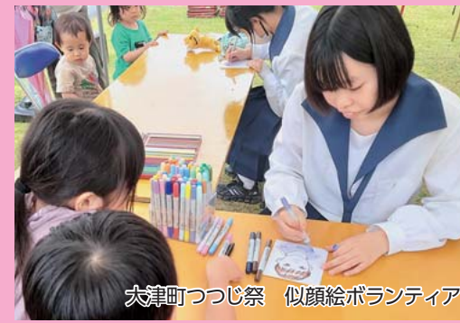
大津町つつじ祭 似顔絵ボランティア