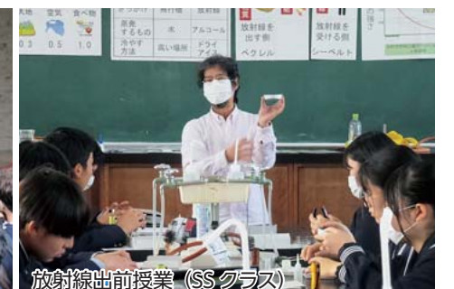
放射線出前授業 (SSクラス)