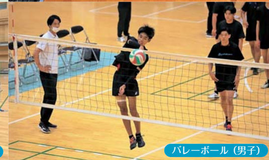
バレーボール(男子)