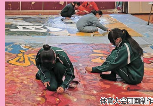
体育大会団画制作