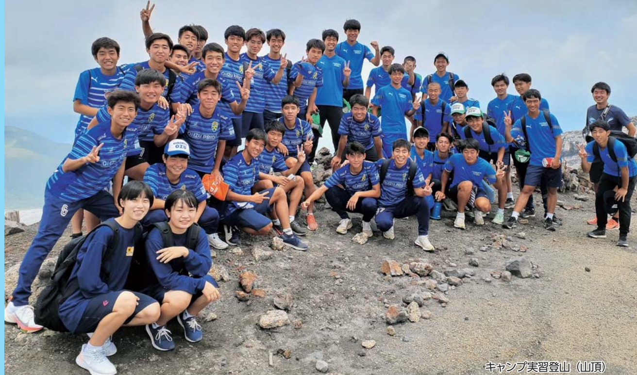
キャンプ実習登山(山頂)