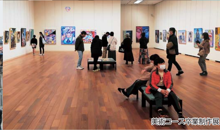
美術コース卒業制作展