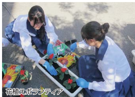
花植えボランティア