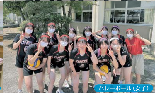
バレーボール(女子)