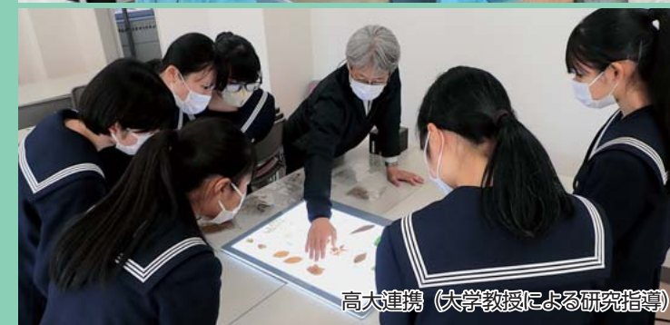
高大連携 (大学教授による研究指導)