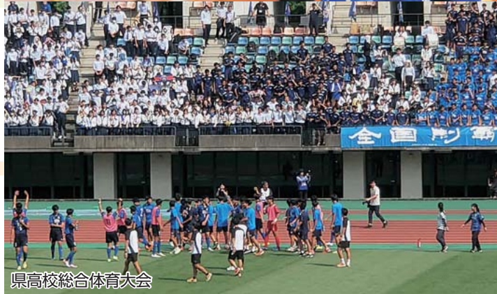
県高校総合体育大会