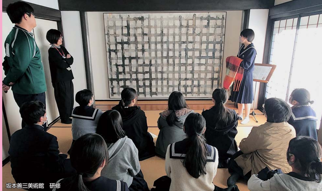
坂本善三美術館 研修