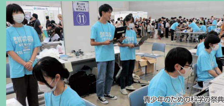
青少年のための科学の祭典