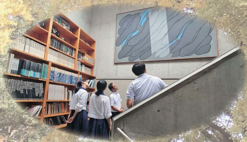
美術棟内展示 『連帯』坂本善三