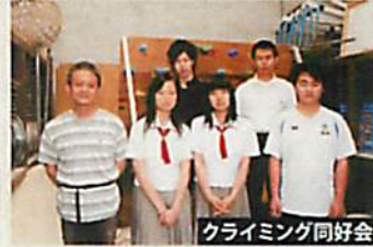
クライミング同好会