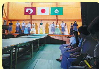
フェスティバル(文化祭)