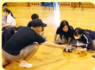
台湾の大学生と交流