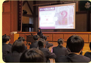
尚志オリエンテーション