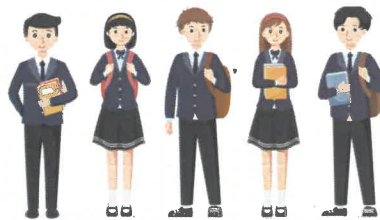
高校生が地域を探究し商品を探す