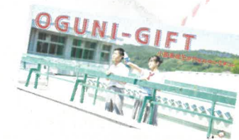
完成したギフトをふるさと納税返礼品へ登録・販売、直販も可能

高校生・地域・自治体・企業が一体となることで 6方良しの未来・持続可能な社会の実現を目指します。