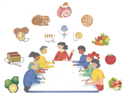
商品を選定し1冊のギフトにする