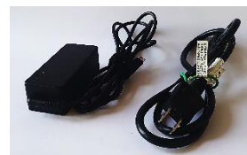
↑ACアダプタ 電源ケーブル