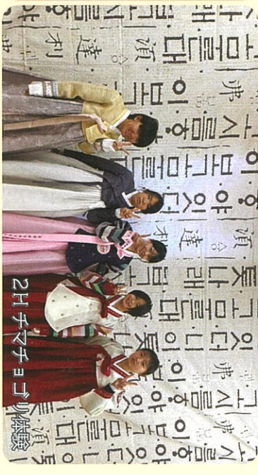
2H チーズチョコ体験