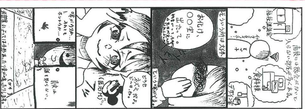
「真実はいつも1つのはず...!」

もう一つは、短期寮による宿泊研修を見学させていただきました。研修内容には畜産の実習や寮での生活を通して社会に必要な生活及び人間関係をよりよくするためのトレーニングを行っていることでした。寮生活を通して、感じ、学んだ事を発表する3分間スピーチでは「最初は嫌だった」と「身の回りの事をすべて自分でやらなさいといけない」という事を不安に思っていた発言もありましたが、最後には「小・中学生で行った集団宿泊とは違い、将来一人で生活する為の練習になった」と発表する生徒さんもおりました。研修の意図をしっかりと理解し学びのある日々だったのだらうと感じました。 南校高校では「企業の求める人材」の中にもあった「自分の事は自分でする」という社会人としての第一歩の経験を学校生活で実際に体験する学習の場がある事に感謝致します。これからは、自分の事を自分でしようとする関係で、寄り添い後ろでしっかりと見守り、支えられる親でありたいと思います。それが、私達親に出来る応援の形だと思えました。 一年間、育友会活動へのご理解とご協力ありがとうございました。