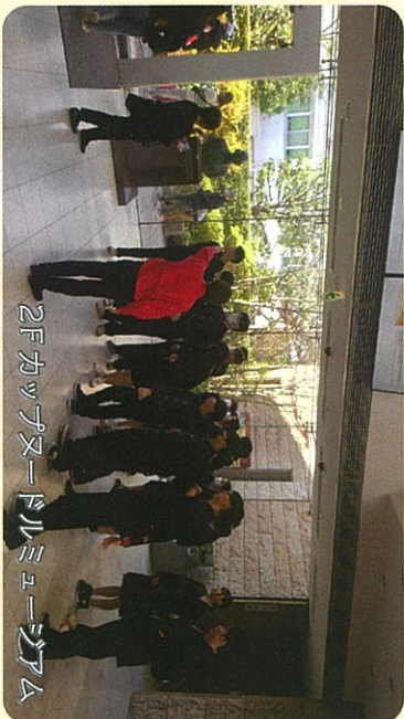
2E カップヌードルミュージアム