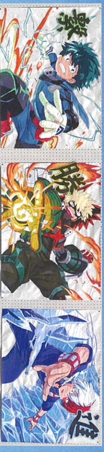
作 文 芸 部

体育大会は雨のため5月16日(火)に延期となりました。平日にもかかわらざる多くの保護者の方に見に来ていただき、実施することができました。コロナが5類になったことにより、今年度は入場行進を行い、3年生のダンスも行いました。総合優勝は3年生でしたが、行進の部、体操の部では2年生が優勝、綱引きでは1年生が優勝するなど、各学年が活躍する体育大会となりました。最後のダンスでは、1・2年生や職員も混じり楽しい雰囲気です。体育大会を終えることができました！