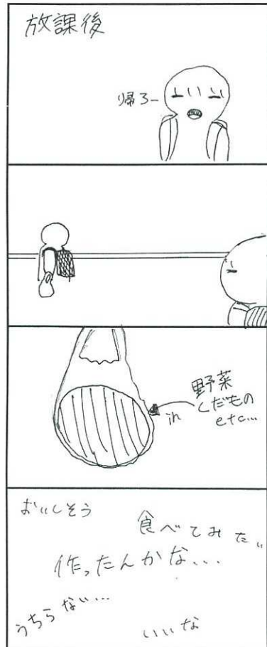
作 3L 福島 綾乃