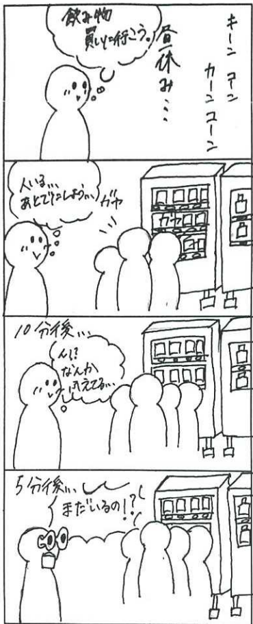
作 1L 宮本 夢巴