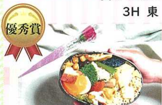
「日頃の感謝」 3H 矢野 絢菜