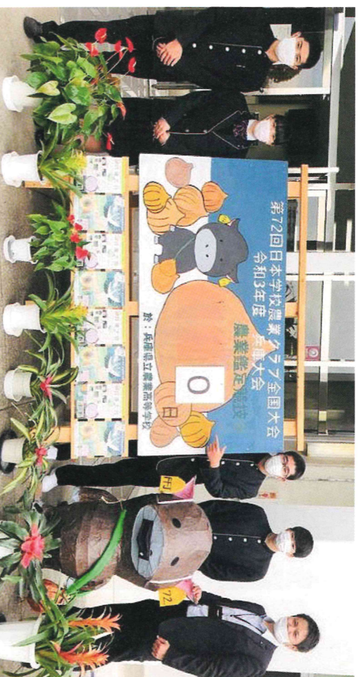
農業鑑定競技会に4名が出場し、全員が優秀賞を獲得!

農業鑑定競技とは、農業の各分野で使用される器具の名称や用途、生物・植物の実物や写真などから判定診断、木材の材積を計算する問題が出題され、限られた時間内で答え、その正答率を競うものです。まさに、日ごろの学習で身に付けた知識や技術の成果を試す競技となっております。競技の結果、惜しくも日本一の栄冠に輝くことはできませんでしたが、参加した全員の生徒が優秀賞に入賞する事が出来ました。