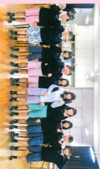
ファッション造形

私たち生活経営科では、農業や衣・食・住・生活と福祉、保育等に関する学習を通じて、生産から消費・環境問題までを総合的に学び、共に生きる豊かな生活文化の創造を目指します。また、農産物の販売活動、郷土料理講習会、近隣保育園との交流学習を通じて地域と連携をとりながら、コミュニケーション能力を身につけていきます。