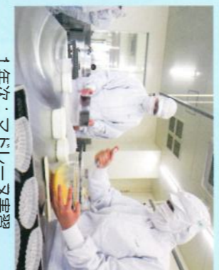
1年次：マイクロ実験