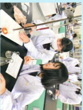
3年次：ビタミンCの定量実験