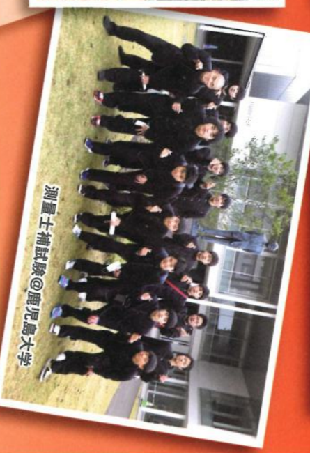
測量士補試験@鹿児島大学