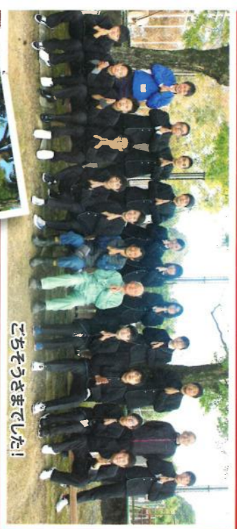
こちらこそさまでした!