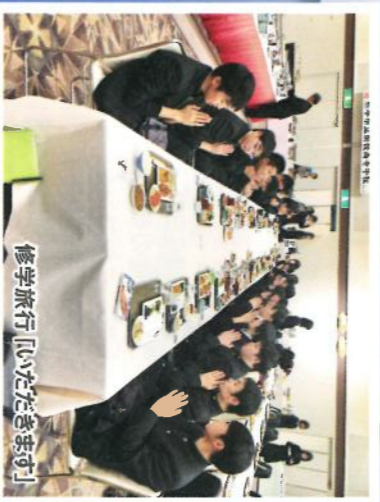
修学旅行【いただきます】