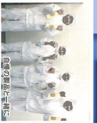
自慢の製品と一緒に