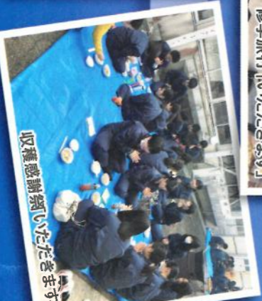
収穫感謝祭【いただきます】