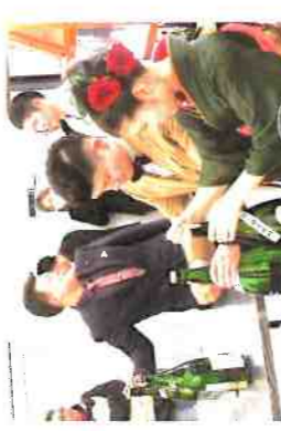
製菓実習 (絞り出しクッキー)