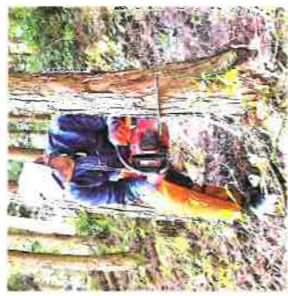
林業就業支援講習