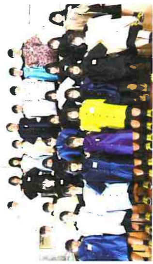
ファッション造形

生活経営科では、農業や衣・食・住・福祉、保育等に関する学習を通して、生産から消費・環境問題までを総合的に学ぶことで、共に生きる豊かな生活文化の創造を目指します。また、農産物の販売活動、郷土料理講習会、近隣保育園との交流学習を通して地域と連携をとりながら、コミュニケーション能力を身につけていきます。