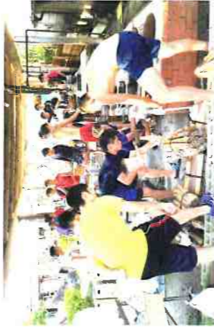
体育コース・野外活動実習

体育コースでは、スポーツをさまざまな視点から捉え、理解を深めることを目標にしています。また、球磨人吉地域の自然を生かした体験活動に積極的に取り組むことで、郷土愛を深めています。