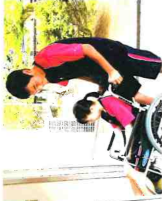
福祉コース・車イス介助校内演習

福祉コースでは、社会福祉の充実・発展に貢献する能力や実践的な態度を育成します。また、病院や福祉施設等での実習を行い、地域社会を支える能力と資質を育てます。