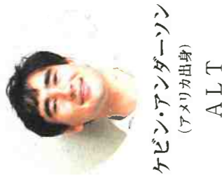
ケビン・アングダーソン (アメリカ出身) ALT