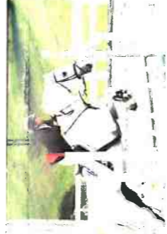
3A 2 明石 絢乃