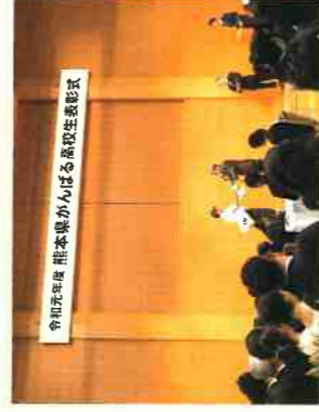
令和元年度 熊本県がんばる高校生表彰式