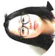
西 麻弥 事務

10月28日(月)5・6限に芸術鑑賞が行われました。今年度は「ファンタジーオプサーカス」の3名にお越しいただきました。一緒に参加したり、間近でのパフォーマンスを見たりするなど、生徒たちは楽しいひと時を過ごしていました。いすを高く積んでのパフォーマンスでは、ハラハラドキドキする人も。大勢の前で人を楽しませることがいかにすごいことかを体感することができました。