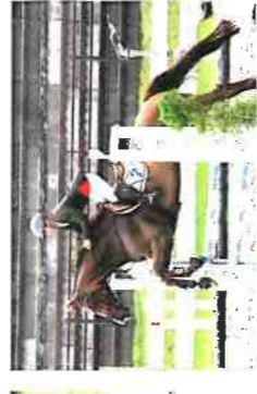
3A2 吉鶴 涼太郎