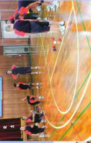
体育コースボッチャ体験

福祉コースでは、社会福祉の充実・発展に貢献する能力や実践的な態度を育成します。また、病院や福祉施設等での実習を行い、地域社会を支える能力と資質を育て、2年生は介護職員初任者研修を修了します。