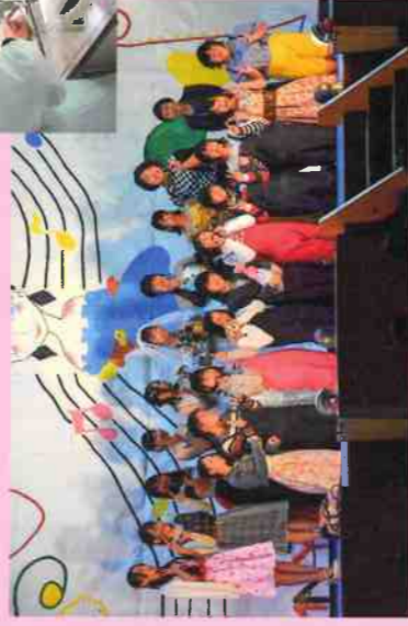
H30 ファッションショー

私たち生活経営科では、農業や衣・食・住・生活と福祉に関する学習を通じて、生産から消費・環境問題までを総合的に学び、共に生きる