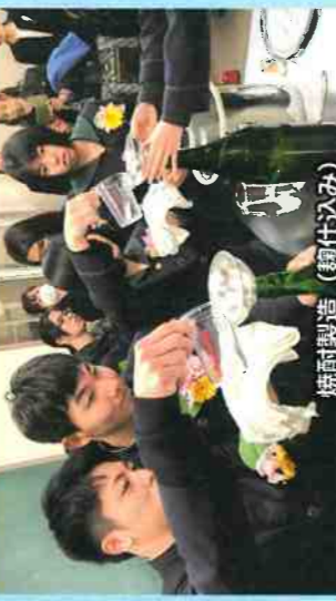
焼酎製造(鍾仕込み)