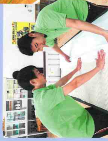
ベッドメイキング

体育コースでは、スポーツ振興や健康増進に貢献する能力を育成し、将来スポーツをおとして地域のリーダーとなることを目指します。