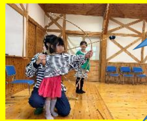
大人から子どもまで、みんな楽しんでました