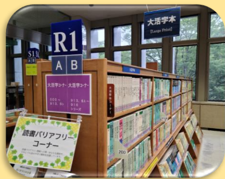
県立図書館の「拡大図書」コーナー