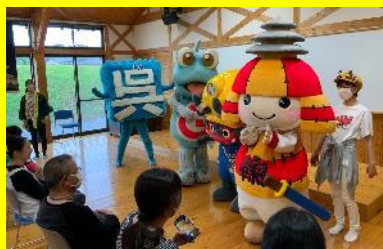
ころう君と仲間たちによる楽しいショー