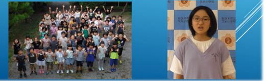
多良木町立久米小学校

テーマ 「みんななかよく、 がっこう げんき ちいき 学校の元気を地域にとどけよう」