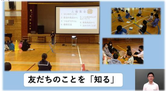
友だちのことを「知る」