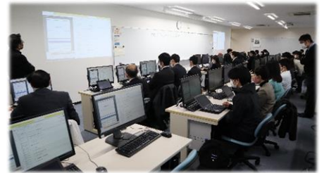
高校・情報Iプログラミング担当者研修会の様子

熊本高等専門学校との連携の一環として、「第1回高校・情報Iプログラミング担当者研修会」を実施しました(R5.2.15)。高等学校の「情報I」を担当する教員に対し、熊本高専の教員が講師となりプログラミング演習を行いました。