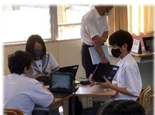
考えを表現するツールとしての端末活用