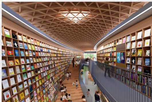
熊本県ホームページ