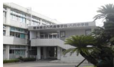
県立八代中学校・八代高等学校

～熊本県では、令和6年度から八代中学校・八代高等学校に国際バカロレアの導入を目指しています～