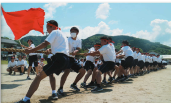
綱引き：エゴれ！引け！引きまくれ！