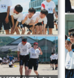
番外編「素敵な笑顔が印象的でした」