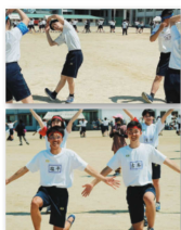
フォークダンス「水高舞踏会」