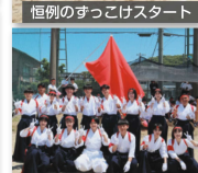
恒例のすっこけスタート