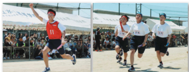
学年別リレー：光の速さで駆け抜けろ