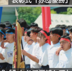
閉会式「みんなて肩組んで」