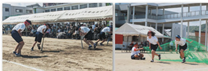
技巧走：サバイバルラン