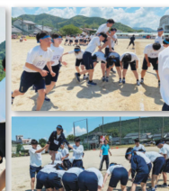
背中渡り：今日、橋になりました。