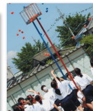
玉入れ：この気持ち受け止めて