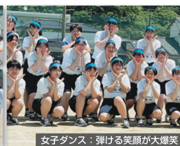
女子ダンス：弾ける笑顔が大爆笑