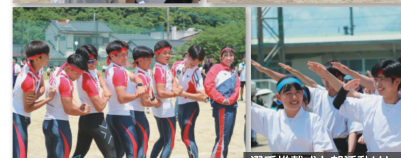
選手推戴式と部活動リレー