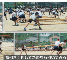
棒引き：押してためなら引いてみる