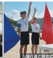
入場行進と開会式