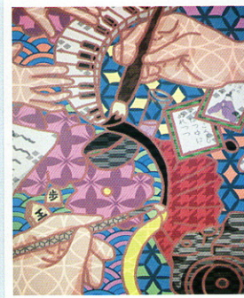
令和2年度熊本県総合文化祭 ポスター原画コンクール展最優秀賞 3年 宮守茉那