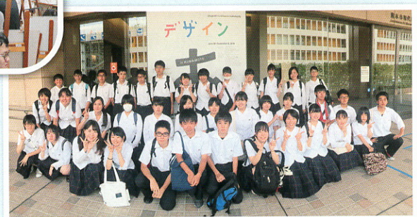
美術館研修：年に数回、美術館に足を運び研修を行います。