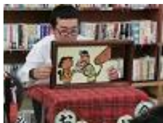
文化図書委員によるおはなし