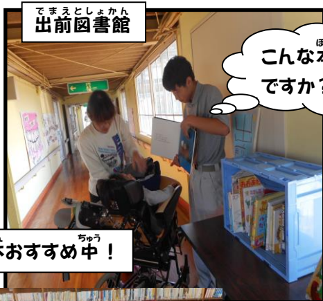
でまえとしょかん 出前図書館