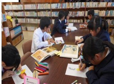
えほん 絵本おすすめ中！