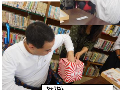
ちゅうせん 抽選ドキドキ・・・