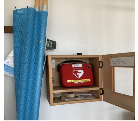
体育館（後方出入口）