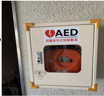
職員玄関（事務室前）

松橋高校には、AEDが2か所に設置してあります。 AEDとは・・・心臓が正しく動いていない時に、電気ショック を与えて、心臓の動きを整える医療機器です。