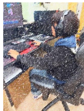
動画作成(生活訓練)