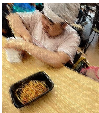
フルーツキャップ束ね(B型)