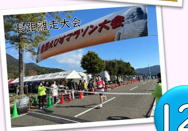
長距離走大会 長距離走大会 クラスマッチ