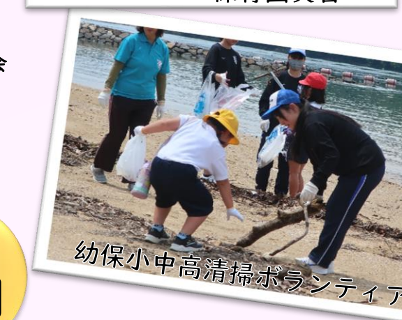
幼保小中高清掃ボランティア