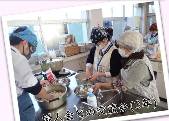
婦人会との交流会(3年)