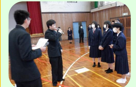
▲人間関係づくりワークショップの様子