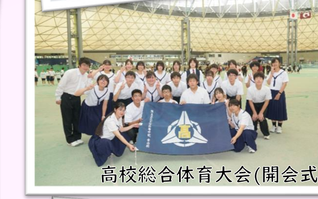
高校総合体育大会(開会式)