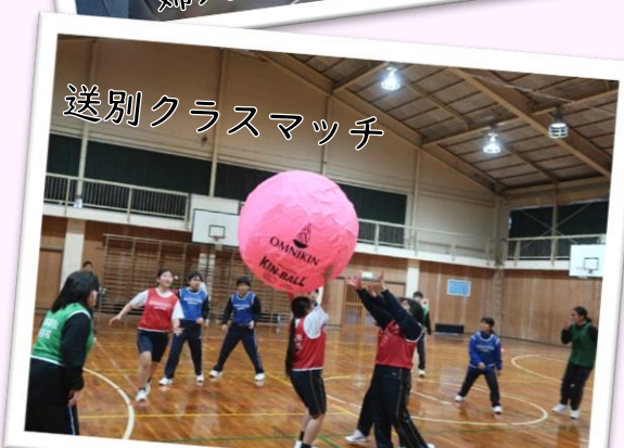
送別クラスマッチ