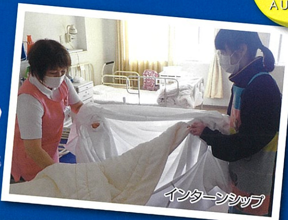
インターンシップ