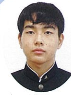
1年 浦西 (倉岳中学校)