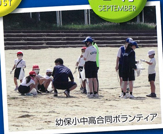
幼保小中高合同ボランティア