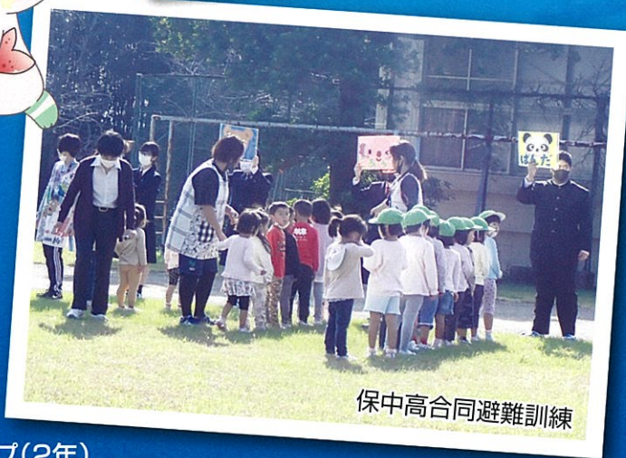
保中高合同避難訓練