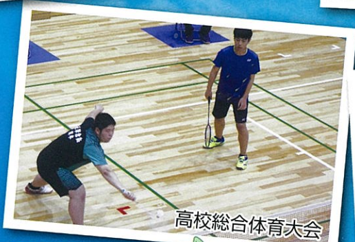
高校総合体育大会

中間考査 生徒総会 幼保訪問実習(2年) 保中高合同避難訓練 幼保小中高合同ボランティア