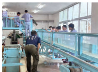
農業土木施工実習