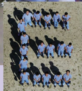
ドローンによる空中写真測量

農業と農村・地域を支える技術者を育てる、県内唯一の農業土木科です。 校外活動や連携事業を取り入れ、主体的な学びと実践する力を育成します。 細かな進路別指導を実施し、就職（公務員・企業）、進学をサポートします。