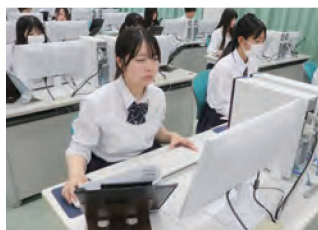
資格取得への取り組み