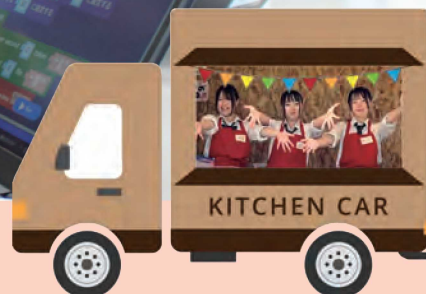
キッチンカーと商品開発

農業科目と商業科目を学べる全国的にも珍しい学科です。 農産物栽培⇒流通⇒情報発信まで、農業をビジネスとして学びます。 地域と連携したフィールドワークが特徴で実践力の習得を目指します。