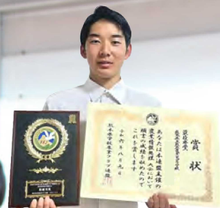
農業情報処理競技会 県大会6連覇!