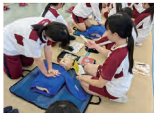
幼児安全法講習会