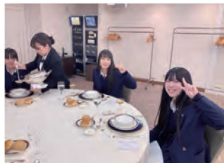
テーブルマナー講習会