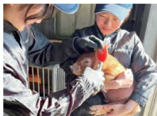
子ブタの飼育管理