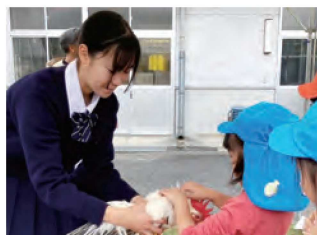
園児との交流授業