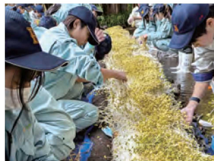
水前寺もやしの収穫