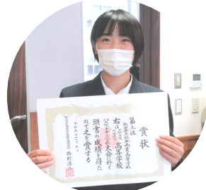
【バスケットボール部】 令和2年度熊本県下高等学校 バスケットボール選手権 第3位