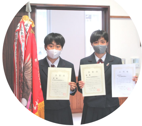
【ソフトボール部】 第15回全九州高等学校ソフトボール秋季大会熊本県予選 優勝 第39回全国高等学校女子ソフトボール選抜大会熊本県予選会 優勝