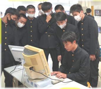
タイピングランキングバトル