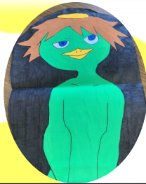
図書委員会・放送部 オリジナル脚本のパネルシアター