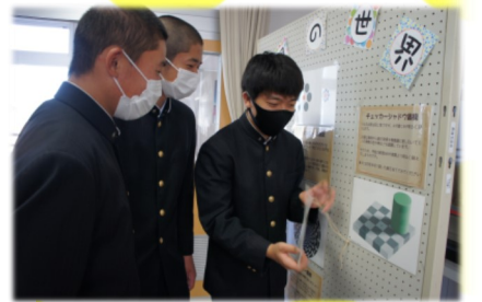
科学部 錯視の展示