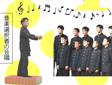
音楽選択者の合唱