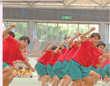
カッコいいねえー♡