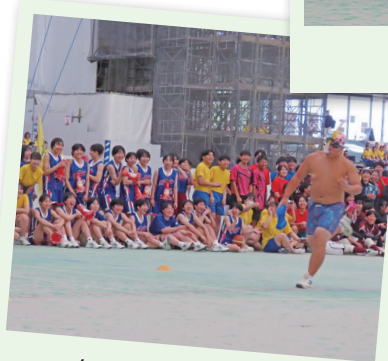
あなたも NO. 1 笑