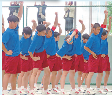
いっちにっ さんっ しっ