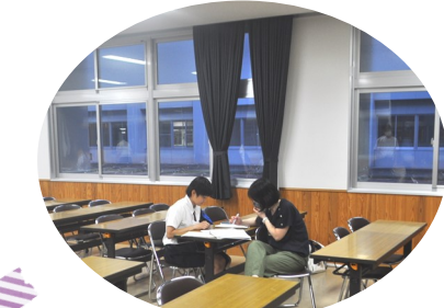
検定に向け猛勉強！