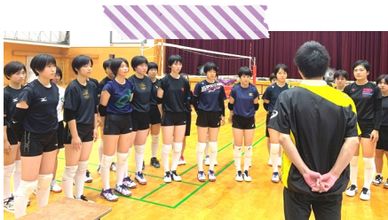
1年生も部活動頑張ってます☆