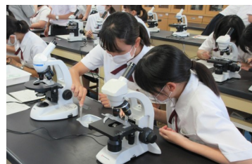
顕微鏡での観察実習

新型コロナウイルスの影響で休校が続いていましたが、6月1日から学校生活が再開されました。文部科学省通知の「学校の新しい生活様式」と題した衛生管理マニュアルに基づき感染リスクを減らしての教育活動を続けていきます。