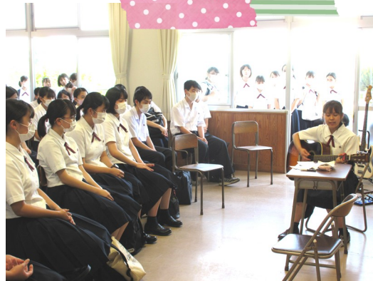
ギター部のプチ演奏会♪