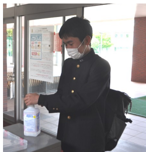
手の消毒や検温で感染対策もバッチリです！