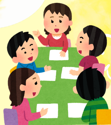
座談会 (対象：保護者)