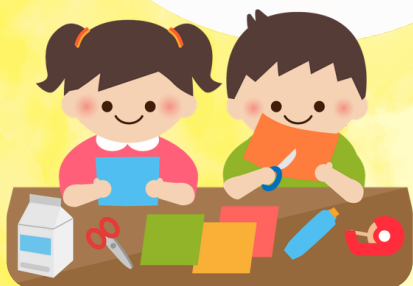
制作遊び・リズム遊び (対象：乳幼児)