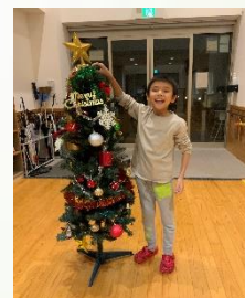
クリスマス飾りつけ