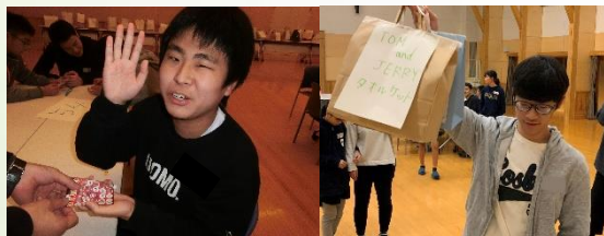
熊本聾学校と交流行事