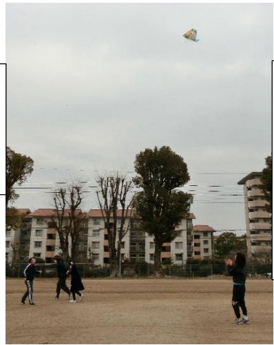
上がった上がった