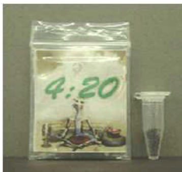
脱法ドラッグ写真： 厚生労働省報道発表資料より

脱法ハーブの危険 県内も 県警によると、県内ではこれまで、脱法ハーブに起因する重大事故は起きていない。ただ、昨年1月には熊本市の繁華街で街路樹に衝突した男性が「直前に脱法ハーブを吸った。事故を起こした記憶がない」と話した。県によると、薬物を使ったとみられる症状での緊急搬送も2012～13年度で6人に上った。 熊本市こころの健康センター前所長は、「薬物の種類、分量にばらつきがあり、命を奪われかねない」と指摘する。