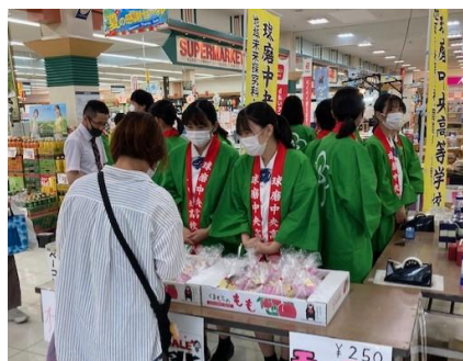
錦町の新鮮なフルーツなど販売しています！

球磨中央高校の所在地である「錦町」と2年前から連携して、錦町の特産品や特産物を中心に販売を行う「チャレンジショップ」を行っています。錦町のサンロードシティS Cの場所をお借りして、「フルーツの里にしき」を広めるために、その時期に合わせたフルーツ等を販売しています。またオリジナル商品も開発し、販売しました！錦町が地元農家と調整くださったおかげで、高校生自らが仕入・販売・利益計算などを行うことができました。まさに「生きた実学」を体験できる環境がここにあります！