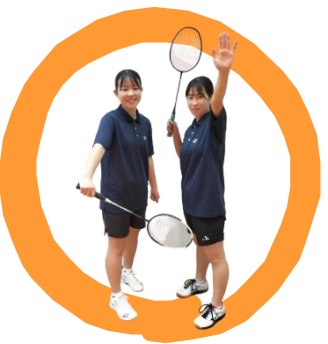
女子バドミントン

人吉球磨地区でも珍しいバドミントン部がある学校です。先輩の後輩の仲が良い部活です。経験がなくても先輩や顧問が丁寧に教えます。活動は原則毎週金曜日と日曜日が休みです。僕たちと一緒にバドミントンをして、高校生活を満喫しませんか？