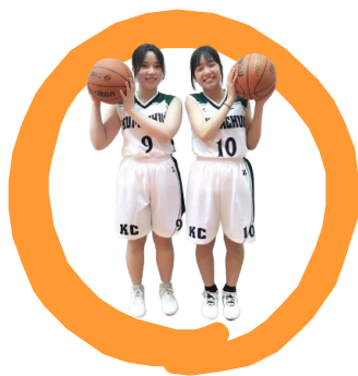
女子バスケットボール

女子バレーボール部は、選手8名で活動しております。元気な部員と情熱の顧問で楽しく活動しております。「少人数でも勝てる」と「限られた条件でもできる」をモットーに活動しております。刺激が欲しい人や未経験者も大歓迎です！お待ちしております。