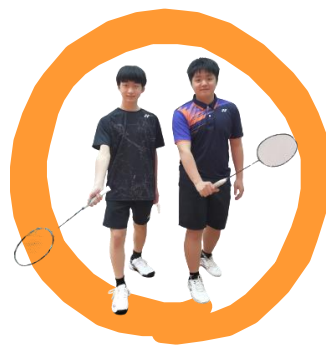
男子バドミントン

弓道部は、明るい雰囲気の中で自立を目指して日々練習に取り組んでいます。部員のほぼ全員が、高校に入学してから弓道を始めました。弓道に興味のある人、または別の武道を行っていた人、ぜひ弓道部をチェックして下さい。