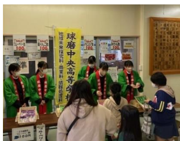
人吉東小学校にて出張販売実習