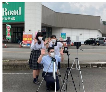
チャレンジショップのPRのためのYouTube撮影