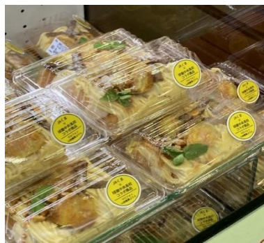
J A球磨×球磨中央高校 コラボ商品「マロフォン」

今年度は昨年度からお世話になっている商品コンサルタントの外部講師を招き、錦町の特産物を使った新商品開発を行います。是非、ご期待ください！