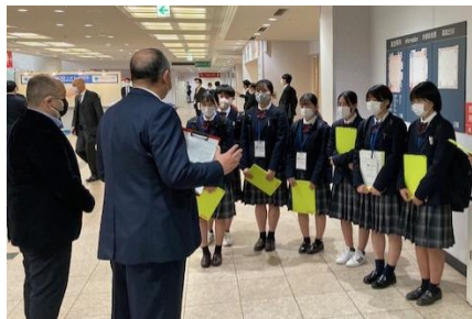
商談会（福岡県）の現場視察。