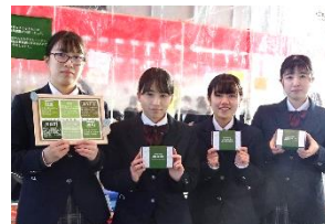
開発した商品も販売