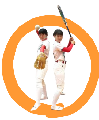
女子ソフトボール

女子ソフトボール部はチームワークが良く、活気溢れる部活動です。顧問の先生は、ピッチャーとして全国・世界で活躍されました。楽しくソフトボールができ、人として成長できる部活動です。初心者大歓迎！入部待ってます！