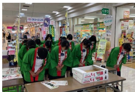
すべての商品が完売しました！ありがとうございました！