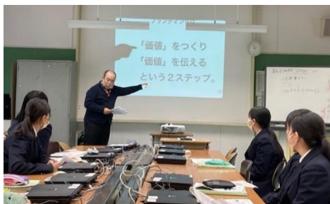
商品開発の専門家を招いた授業を実施！