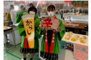
2日間、本校体育館で開催