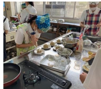
自分たちが考えた商品を実際に調理室で試作。