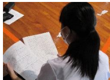
(職業インタビュー)