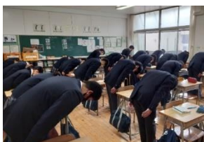
接客用語、お辞儀の練習