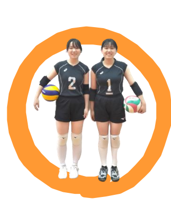
女子バレーボール

女子ソフトボール部はチームワークが良く、活気溢れる部活動です。顧問の先生は、ピッチャーとして全国・世界で活躍されました。楽しくソフトボールができ、人として成長できる部活動です。初心者大歓迎！入部待ってます！