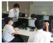
(ビジネスプラン作り)