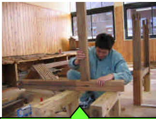
柱の継ぎ木部分との取合い