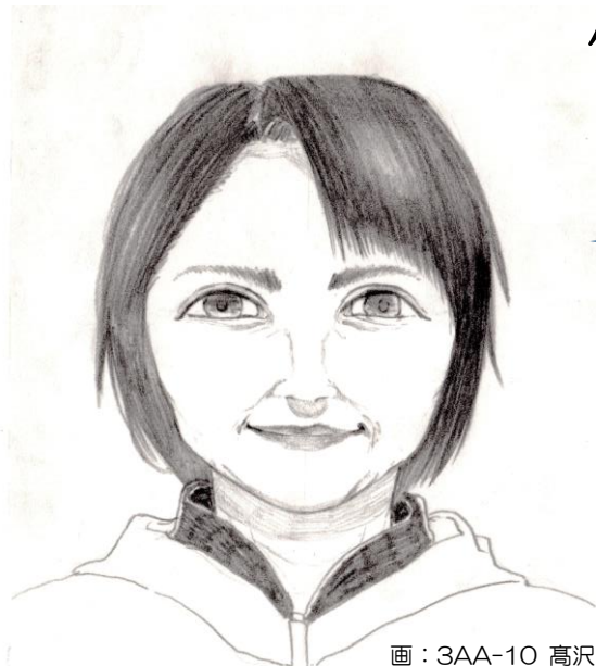
画：3AA-10 高沢 優晏