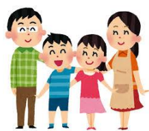
障がいのある方 （本人、家族）