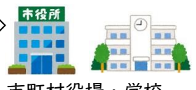
市町村役場・学校