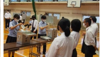
投票している様子