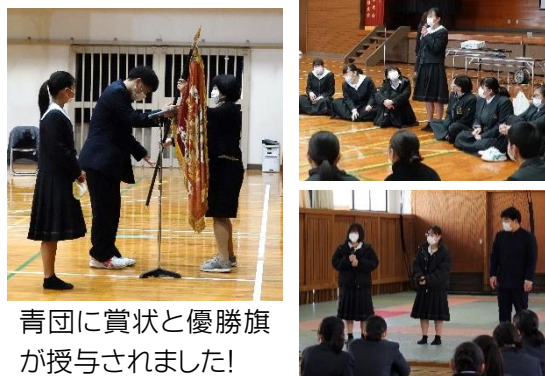
青团に賞状と優勝旗が授与されました!

12月24日(金)に、5月の体育大会から始まったスポーツフェスティバルの総合閉会式と解団式が行われました。これまで行われた各大会のMVPも発表され表彰が行われました。閉会式後は、各団で解団式が行われ、長い戦いに幕が下ろされました。