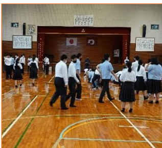
体育館に避難している様子

5月20日（木）の中間考査最終日に避難訓練が実施されました。今回は、緊急避難時の点呼及びその方法を確認する訓練として行われました。生徒たちは安全な避難経路を確認しながら、真剣な表情で落ち着いて体育館に避難しました。校長先生からは、いつどこで災害が起きるかわからないけれども、安全（命）を第一に考えて平常心で行動することが大切だという話がありました。