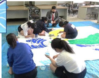
大会幕制作の様子