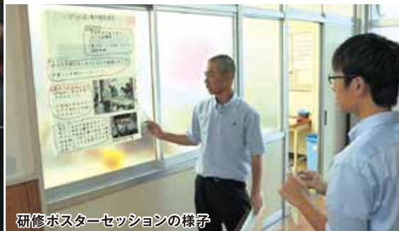
研修ポスターセッションの様子