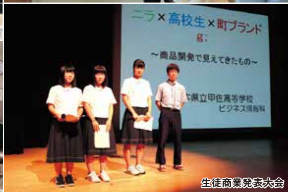
生徒商業発表大会