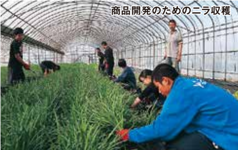
商品開発のためのニラ収穫