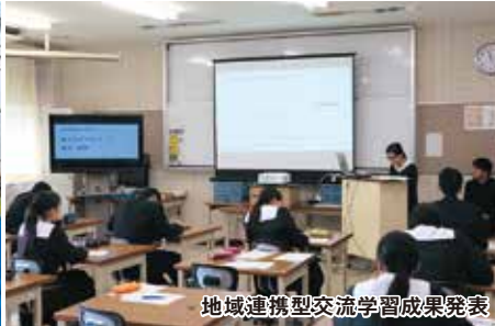
地域連携型交流学习成果発表