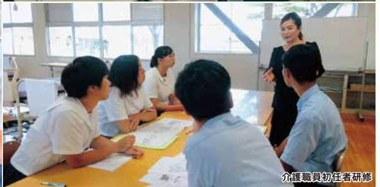
介護職員初任者研修