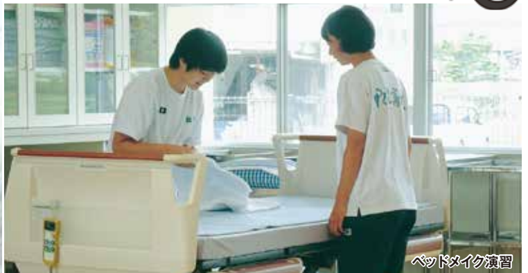
ベッドメイク演習