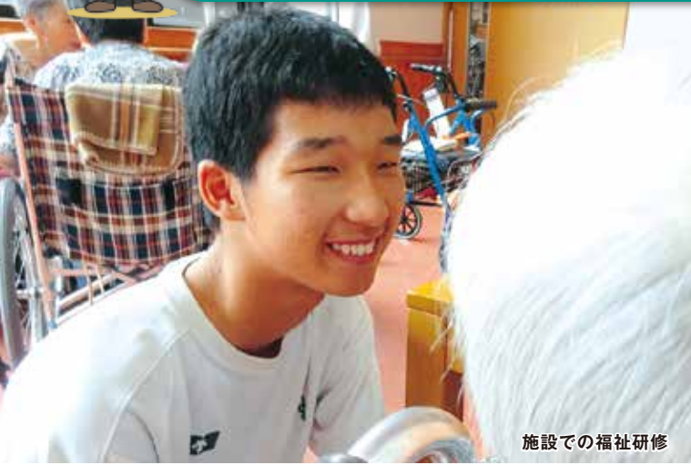
施設での福祉研修